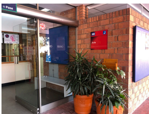
Todas las imágenes de esta convocatoria pertenecen a © María Sicarú Vásquez Orozco, 2021