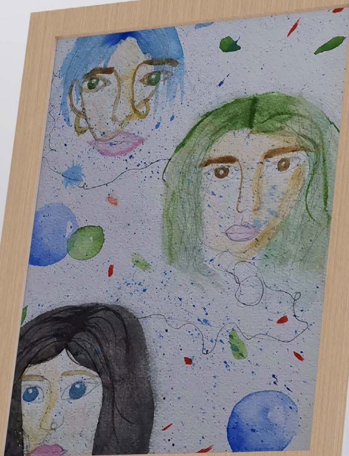
Azul Tapia, sin título, 2021, acuarela sobre papel