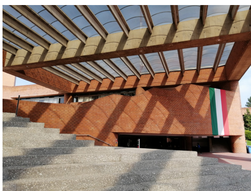
Todas las imágenes aquí presentadas son autoría de © Alberto Soto Cortés, 2021