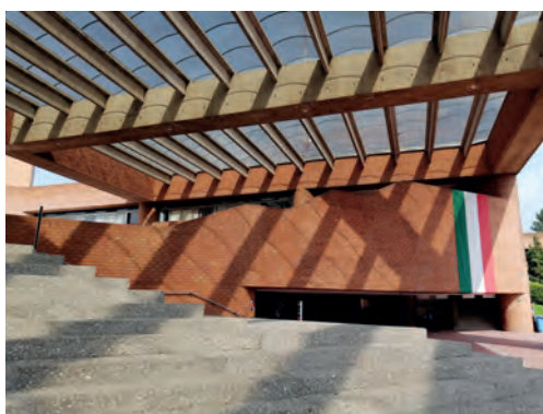
Todas las imágenes aquí presentadas son autoría de © Alberto Soto Cortés, 2021